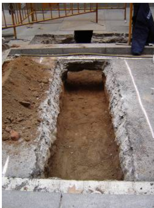
Fotografia 2. Encreuament entre la Plaça Duc de Medinaceli i el carrer Nou de Sant Francesc