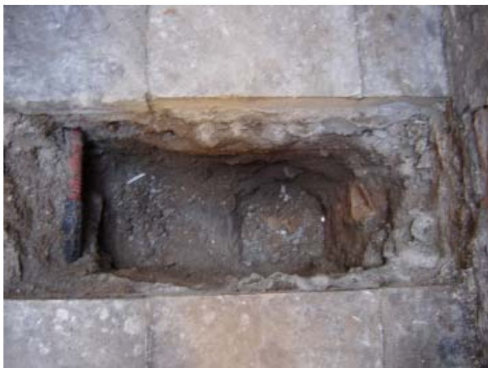
Fotografia 1. Cala de comprovació a la Plaça Duc de Medinaceli i aparició de serveis