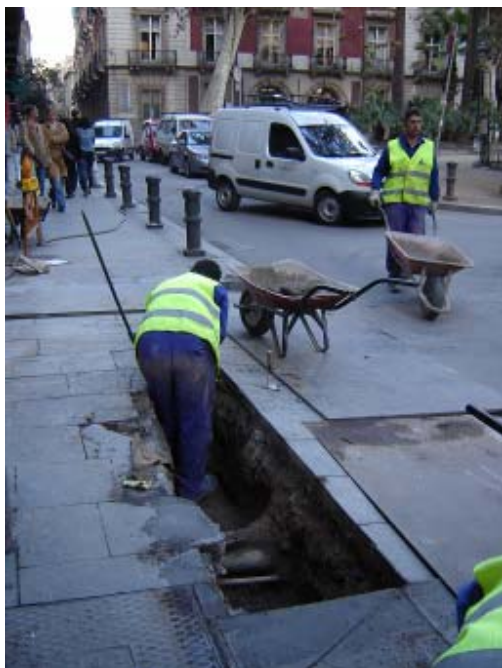
Fotografia 3. Treballs a la vorera de la plaça del Duc de Medinaceli amb el carrer de Josep Anselm Clavé